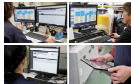
右上：KP-コネクトプロで印刷・後加工の進捗と予定を確認。 左上：KP-コネクトプロで後加工の予定を組む。 右下：iPadで無線綴じ機のジョブを確認。 左下：iCE LINKで中綴じ機のジョブ操作。

※全ての加工機材： ホリゾン製ペラ丁合中綴じ機「ICE STITCHLINER Mark IV」& マネジメントシステム「ICE LINK」 芳野YMマシナリー製無線綴じ機「VEGA」、中綴じ機「hohner HSB9.000」、その他折り機等